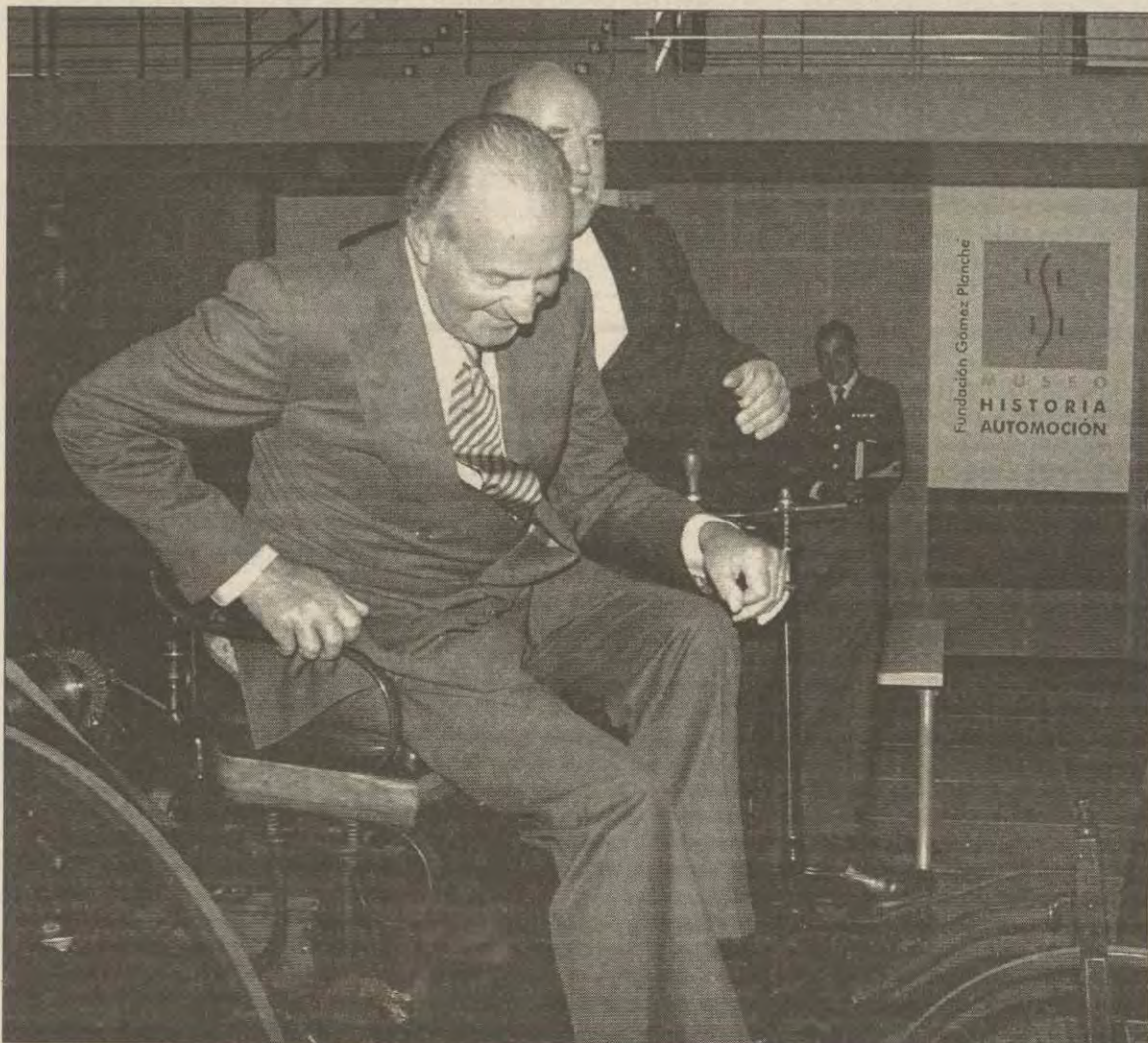
Don Juan Carlos se monta en un triciclo Benz de 1885.

Vaticinó que el Museo de Historia de la Automoción inaugurado ayer «nace con vocación de centro dinámico y suscitará un gran interés», y sobre el acto en la Universidad consideró que ha sido «notable por la presencia de dos de las grandes instituciones de España: la Universidad de Salamanca y la Corona».